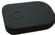
1 pav. ID kortelė.

ID kortelė (1 pav.) ir sisteminis blokas palaiko dvipusį radijo ryšį kintančiu kodu 2,4 GHz dažnių diapozone. ID kortelės baterija rekomenduojama keisti kas 12 mėnesių. Tinka visos CR2032 tipo 3V baterijos. Vairuotojas identifikuojamas, kai asmuo, turintis įjungtą įprogramuotą ID kortelę patenka į ryšio zoną. Tokiu būdu variklio blokavimo išjungimas arba 'anti-carjack' proceso nutraukimas nematomas pašaliniam. Išjungus degimą ir paspaudus ID kortelės mygtuką sistemos šviesos diodas informuoja apie įprogramuotą ID kortelių skaičių ir ryšio kanalo numerį. Šviesos diodo blyksnių paketų kiekis 5 sekundžių intervalais atitinka įprogramuotą ID kortelių skaičių, blyksnių kiekis pakete atitinka naudojamo ryšio kanalo numerį. ID kortelė nėra skirta naudoti kaip raktų pakabukas. Ji turi būti atskirai nuo transporto priemonės raktų! ID kortelę būtina saugoti nuo lietaus ir sniego!